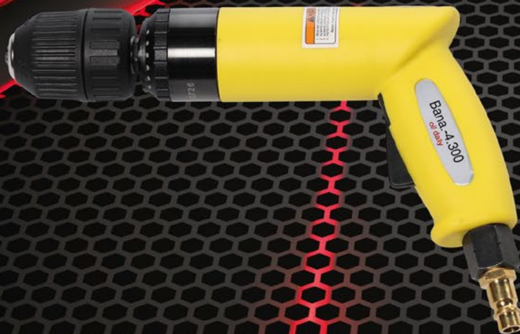
Luftbohrmaschine Typ 145 Banane, normales Bohrfutter Artikelnummer: 102912

Pneumatische Bohrmaschine für anspruchsvolle Bohr-, Schleif- und Polierarbeiten. Auch mit Folienradierer einsetzbar. Mit normalem Bohrfutter oder Schnellspannfutter erhältlich. Drehzahl: 4300 U/min | Luftverbrauch: ca. 200 L/min | Arbeitsdruck: 6,3 bar | Gewicht: ca. 800 g | Aufnahme: Bohrer bis 10 mm