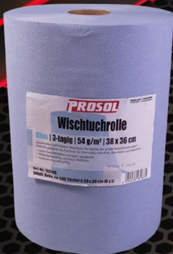
Wischtuch blau 3-Lagig (500 Tücher), 38 cm x 36 cm Artikelnummer: 103146

Universelles, stark saugendes Reinigungstuch. Erhältlich als Großrolle, z. B. passend für den Papierständer fahrbar, oder als handliche Kleinformat-Rolle für die Werkbank, etc.