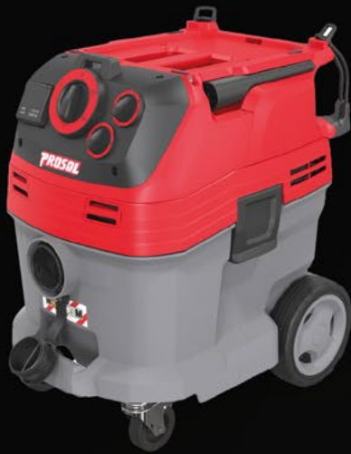
Industriesauger PR30-M Artikelnummer: 328671

Nass- und Trockensauger für hohe Anforderungen bei täglichen, harten Arbeitseinsätzen auf Baustellen und in Werkstätten. Gerätesteckdose mit Ein-/Ausschaltautomatik. Zugelassen für Stäube der Staubklasse M. Ein gegen Feuchtigkeit unempfindlicher PES-Flachfilter trägt ebenfalls zu einer staubfreien Arbeitsumgebung bei. Drehschalter zur stufenlosen Regelung der Drehzahl. 4 m Saugschlauch 35 mm, Fugendüse und Vlies-Filtertüte. Spannung / Leistung: 220 - 240 V, 1380 W | Geräuschpegel: 69 dB | Behälterinhalt: 30 L, Kunststoff | Gewicht: 13,5 kg | Luftmenge: 143 m 3 /h | Abm (L x B x H): 560 x 370 x 580 mm | Anschluss / Endstück: Ø 55 / 35 mm