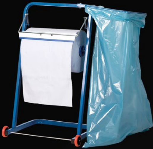
Bodenständer für Putz- und Wischtücher, mit Müllsackhalter Artikelnummer: 315939

Einfacher, preiswerter Putzpapier-Bodenständer mit Abreißkante für Rollen bis zu 38 cm Breite, mit Rollen und Müllsackhalter.