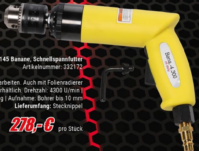
Luftbohrmaschine Typ 145 Banane, Schnellspannfutter Artikelnummer: 332172

Pneumatische Bohrmaschine für anspruchsvolle Bohr-, Schleif- und Polierarbeiten. Auch mit Folienradierer einsetzbar. Mit normalem Bohrfutter oder Schnellspannfutter erhältlich. Drehzahl: 4300 U/min | Luftverbrauch: ca. 200 L/min | Arbeitsdruck: 6,3 bar | Gewicht: ca. 800 g | Aufnahme: Bohrer bis 10 mm