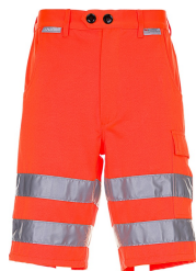
uni orange 2015