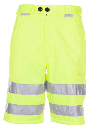
uni gelb 2014